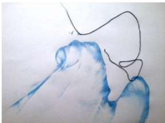
Рис. 3. След от окрашенной нитью

Аппликация нитками – это разновидность ниткографии, когда при работе вместо цельных ниток используются кусочки, то есть нити нарезаются небольшими отрезками, которыми засыпается пространство рисунка (рис. 5).