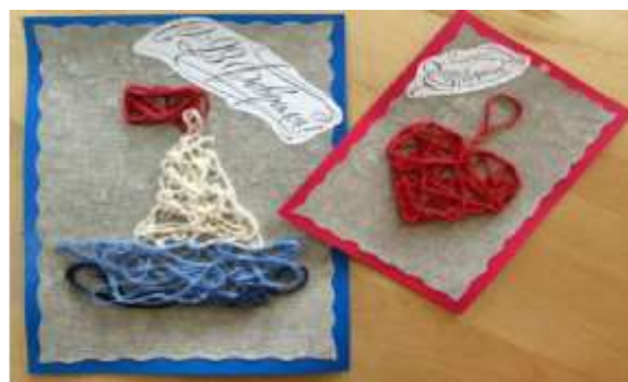
Рис. 2. Работы в технике плетения на каркасе