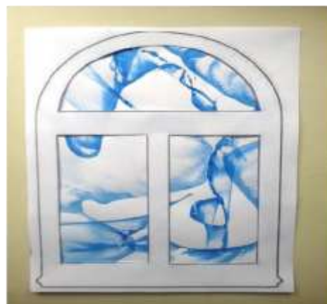
Рис. 4. Морозные узоры за окном