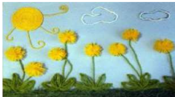
Рис. 6. Одуванчики

Итак, ниткография выполняет существенные функции в формировании личности ребенка. В ней отражаются и развиваются знания и умения, полученные на занятиях в ДОУ, закрепляются правила поведения, к которым приучают детей в жизни. Ниткография выступает как ведущий вид детской деятельности и как важнейшее условие общественного воспитания. В продуктивной деятельности развиваются необходимые каждому ребенку умственные способности, уровень развития которых, безусловно, сказывается