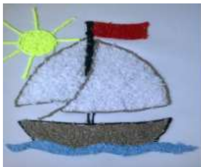
Рис. 5. Лодочка в технике аппликации нитками